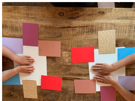
und mit sechs farbigen Blättern.

Dies erfordert sehr viel Konzentration von den Kindern.