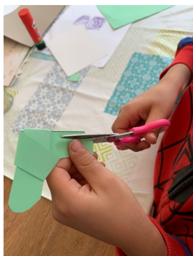
Schnitte einschneiden für den Schwanz, Köpfchen abrunden