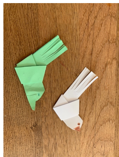
Schnabel aufkleben und fertig©