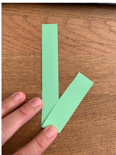
Falten nach Anleitung