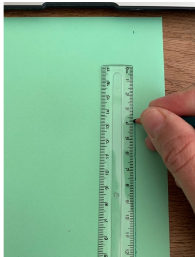
Eine Linie zeichnen mit dem Lineal